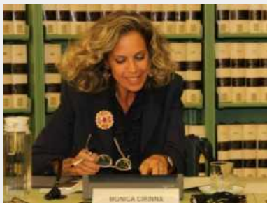
— La senatrice del Pd Monica Cirinnà

Battaglia procedurale e di contenuti sul ddl Cirinnà, la legge che dovrebbe finalmente regolamentare le Unioni civili anche in Italia. Al centro dello scontro c'è sempre la questione delle adozioni. L'art.5 che regola la stepchild adoption una materia incandescente su cui si stanno schierando perfino pediatri, psicologi e psichiatri. E per ultimo è arrivato anche il direttore di Radio Maria, l'emittente ipercattolica che si sente in ogni angolo d'Italia, meglio e di più della Rai, per ricordare alla parlamentare democratica con una caduta di gusto perfino peggiore di