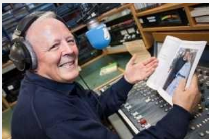
— Padre Livio Fanzaga, direttore di Radio Maria

E c'è anche chi straparla, come la ministra della salute Beatrice Lorenzin secondo cui la stepchild adoption "si traduce nella legittimazione dell'utero in affitto e dell'eterologa" e ci porterebbe niente po' po di meno che all'"ultraprostituzione".